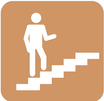
PREFIERA LAS ESCALERAS