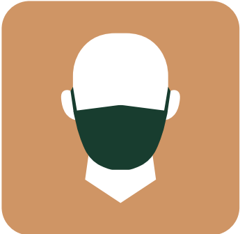
USO DE MASCARILLA OBLIGATORIO