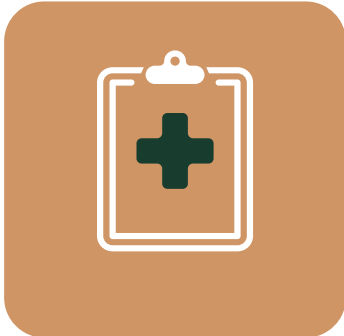
DECLARACIÓN DE SALUD OBLIGATORIA