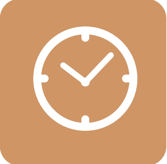
ANTICIPE CHECK IN Y CHECK OUT