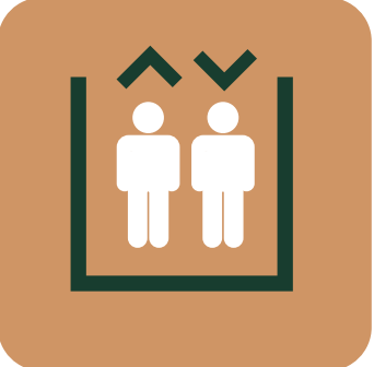
AFORO EN ASCENSORES