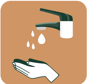
LAVADO DE MANOS