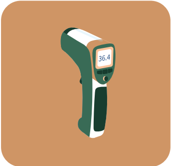
MEDICIÓN DE TEMPERATURA