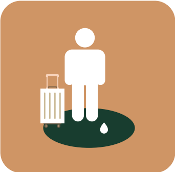
SANITIZACIÓN DE CALZADO Y MALETAS